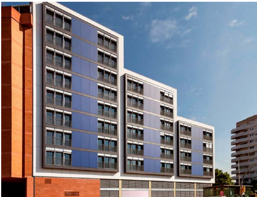
63 habitatges — Ca n'Arus — L'Hospitalet de Llobregat