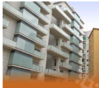
Promoció Institut Català del Sòl

socialització i el contacte amb l'espai exterior a banda de tenir una major control de l'entorn de l'edifici, entenent que el disseny i orientació d'aquest espais entre blocs o be d'accés als habitatges han de deixar de considerar-se espais marginals i convertir-se en el nucli de la convivència veïnal.